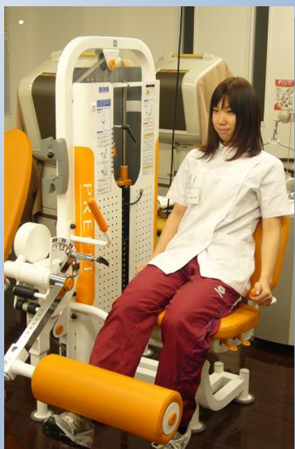
☆レッグエクステンション